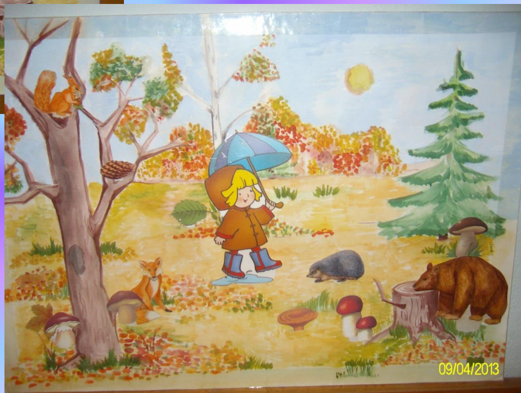
«Осень в лесу»